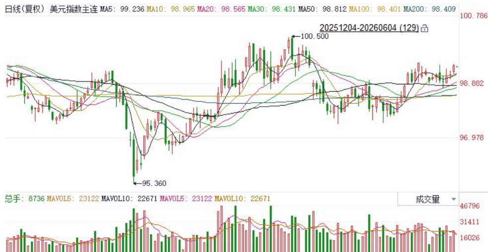
图表1：美元指数走势图

欧洲央行4月会议纪要显示，部分官员实际上已倾向于支持加息。能源供给冲击持续拖累欧元区增长前景，在增长乏力与高通胀并存的困境下，市场继续维持欧央行年内三次加息预期。日本央行行长表示由油价驱动的通胀风险趋于上行，将依据经济与物价走势适时推进加息，使得日央行年内加息预期走强。往前看，伴随停火预期逐步兑现，美国与非美关键利差预期有望收敛，后续或对欧元及日元表现形成边际提振。