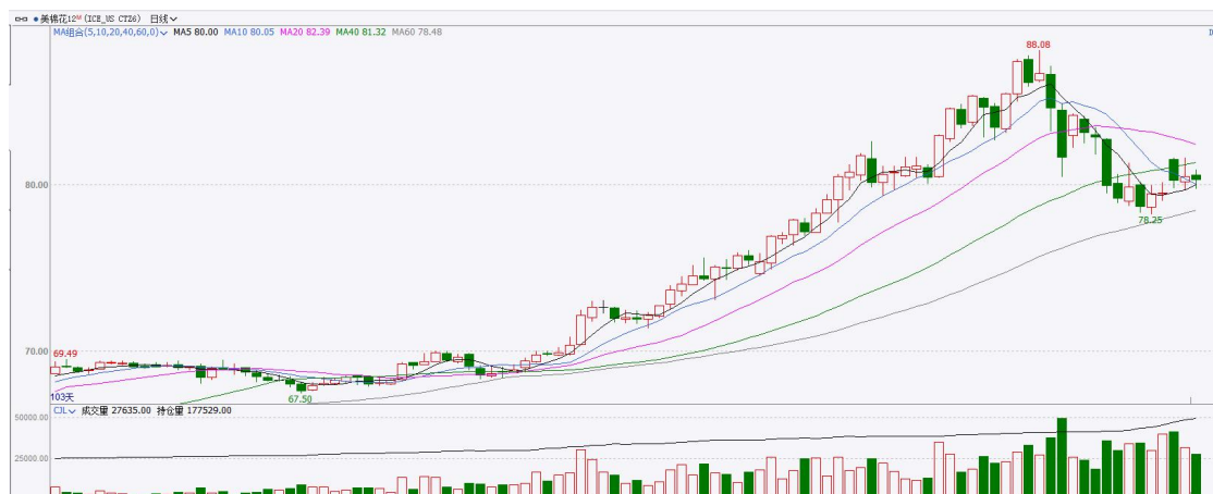
图表7：ICE美棉主力合约价格走势图

国际方面，巴西棉花种植者协会 (Abrapa) 发布月度报告显示，巴西4月棉花出口了37.04万吨，同比大增54.9%，环比增加6.5%，创下月度记录新高。2025/26年度（2025年8月-2026年4月）累计棉花出口达271.1万吨，同比增加了13.7%，其中4月，中国、巴基斯坦和孟加拉国进口了18.93万吨棉花，占比51%。