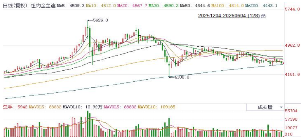
图表5：COMEX黄金日线走势图

美经济数据展现较强韧性，通胀预期仍然高企，联储官员释放鹰派加息信号，贵金属市场延续震荡走弱态势，伦敦金收跌1.22%报4434.45美元/盎司，伦敦银收跌3.19%报72.70美元/盎司，COMEX黄金期货跌1.27%报4462.70美元/盎司，COMEX白银期货跌3.41%报72.98美元/盎司。地缘方面，美伊谈判持续拉锯，在浓缩铀处置、伊朗核问题和霍尔木兹海峡通行的问题达成协议之前，可信的和平协议落地可能性较低，美元指数延续反弹，对金价形成较强压制。宏观数据方面，美国5月“小非农”数据略超预期，叠加5月ISM制造业PMI录得54，创四年新高，就业及PMI数据强劲强化了市场对美联储维持高利率甚至加息的预期；本周重点关注周五发布的美国五月非农就业数据。能源价格与通胀预期存在继续走高的风险，加息预期仍在，一度压制金价；央行逢低购金需求虽边际放缓，但中长期配置逻辑仍具韧性，金价下方逢低买盘需求或继续提供价格支撑。白银短期或跟随地缘冲突持续预期及金价走势震荡，受工业需求波动较大。操作上建议，逢低布局思路对待。技术面，伦敦金短线面临上方阻力位4650美元/盎司，下方支撑4450美元/盎司，日线RSI低于中轴，MACD绿柱收窄；伦敦银关注上方阻力位80、83美元/盎司，下方支撑70、73美元/盎司