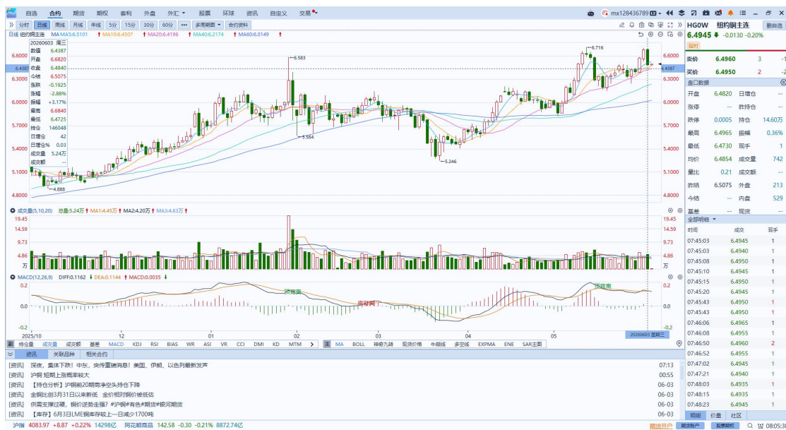
图表4：铜日线走势图

隔夜COMEX铜震荡回落，报收6.484元/磅，涨跌幅-2.88%。国际方面，纽约联储主席威廉姆斯：目前无需加息或降息，不认为前瞻指引特别有帮助；达拉斯联储主席洛根：越来越担心今年晚些时候可能需要加息。美联储褐皮书：近几周美国经济活动和通胀均有所上升。国内方面，据中国物流与采购联合会，5月份中国物流业景气指数为50.3%，较上月上升0.6个百分点，重回扩张区间。分项指数中，业务总量指数、新订单指数、固定资产投资完成额指数、从业人员指数等均位于扩张区间。库存方面，截至2026年6月3日，COMEX铜库存为642164短吨，环比+119短吨；LME铜库存为382550吨，环比-1700吨；SHFE每日仓单96391吨，环比-2238吨。美元美债方面，由于伊朗与美国之间的外交谈判仍处于僵局，美元指数延续上行势头，最终收涨0.33%，报99.53，为连续第三日收涨；基准的10年期美债收益率收报4.500%，对美联储政策利率敏感的2年期美债收益率则收报4.086%。操作建议，纽铜主力合约轻仓逢低短多交易，仅供参考。