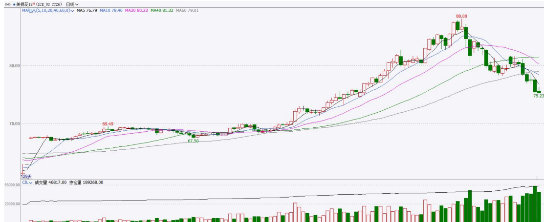
图表7：ICE美棉主力合约价格走势

国际方面，巴据美国农业部(USDA)报告显示，5月28日止当周，美国当前年度陆地棉出口销售净增18.52万包，较前周增加21%，较前四周均值增加62%。当周美国陆地棉出口装运量26.88万包，较前周减少15%，较前四周平均水平减少12%。当周美国棉花出口签约量增加、装船量环比下降。