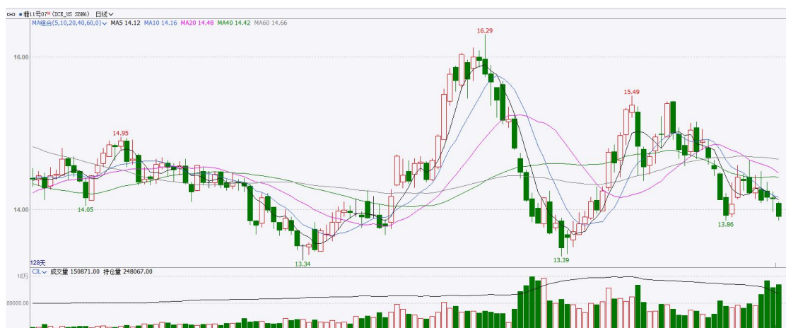
图表6：ICE原糖主力合约价格走势

美糖主力价格关注上方压力15.0美分/磅，下方支撑13.50美分/磅。建议7月 ICE 期糖短期观望。