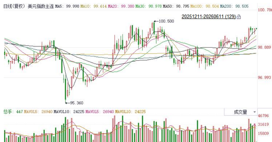
图表1：美元指数走势图

非美方面，利率期货显示欧央行将于本月展开25基点加息，后续或仍有2-3次加息空间，当前鹰派定价主要受最新通胀数据驱动，欧元区5月通胀增速创逾两年半新高，核心通胀同步加速，显示价格压力正从能源领域向更广泛的经济部门扩散。日本4月实际工资实现连续四个月增长，创2021年底以来最长连涨纪录，为6月央行加息提供有力支撑，但受中东局势拖累，家庭实际消费支出同比维持收缩态势。往前看，当前非美主要货币走势仍受到强美元压制，但中长期而言，伴随美伊局势逐步趋缓，美国与非美关键利差预期有望收敛，后续或对欧元及日元表现形成边际提振。