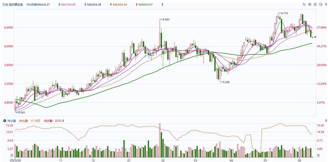
图表4：铜日线走势图

比涨1.2%。工信部：加强高端光电芯片和器件研发，开展光电混合组网技术试验。库存方面，截至2026年6月10日，COMEX铜库存为648843短吨，环比+1082短吨；LME铜库存为369575吨，环比-3075吨；SHFE每日仓单96087吨，环比+544吨。美元美债方面，美元指数震荡调整，维持在近两个月来的最高水平附近，最终收涨0.04%，报99.947；基准的10年期美债收益率收报4.565%，对美联储政策利率敏感的2年期美债收益率则收报4.150%。操作建议，纽铜主力合约轻仓逢低短多交易，仅供参考。