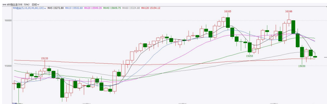
图表3：富时中国A50走势图

截至6月10日，富时中国A50指数下跌0.61%至15467.03；新交所富时A50期指主力合约下跌0.87%至15220。海外方面，美国CPI涨幅三年来首次重返4%，进一步巩固美联储年内加息预期。国内方面，经济基本面，贸易端，5月我国进出口延续高增长态势，出口边际增速高于进口，带动贸易顺差上行。同时，高新技术产品出口增速大幅领先整体水平。物价端，在PPI边际增速大于CPI，令两者正剪刀差进一步走阔。消息面，燧原科技与粤芯半导体申请IPO，而此前长鑫科技、宇树科技已相继过会，具有硬实力的科技企业陆续申请IPO，反映出当前市场对AI主题的热情依旧存在，但头部科技企业集中上市后也将对行业流动性产生稀释。整体来看，目前生产端价格上涨传导至消费端的过程较为缓慢，通胀对居民消费意愿的提振仍然有限。同时，市场对于AI行情的情绪已十分谨慎，不及预期的数据或消息均会加剧市场波动，加上美联储加息预期的升温带来的流动性趋紧预期，对海外人工智能浪潮有负面影响，最后海内外科技巨头相继递交IPO申请后带来的流动性稀释效果，使得相关板块承压，市场整体短期或步入震荡态势。