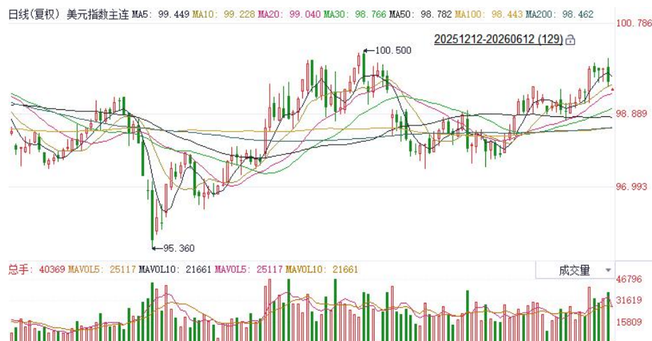
图表1：美元指数走势图

在持续的通胀压力驱动下，欧央行如期加息25基点，利率期货市场显示后续或仍有2-3次加息空间，欧元区5月CPI增速创逾两年半新高，核心通胀同步加速，显示价格压力正从能源领域向更广泛的经济部门扩散，使得欧央行内部基调显著转鹰。日本4月实际工资实现连续四个月增长，为日本央行加息提供有力支撑，但受通胀走高拖累，家庭实际消费支出同比维持收缩态势。往前看，当前非美主要货币走势仍受到强压制，但中长期而言，伴随美伊局势逐步趋缓，美国与非美关键利差预期有望收敛，后续或对欧元及日元表现形成边际提振。