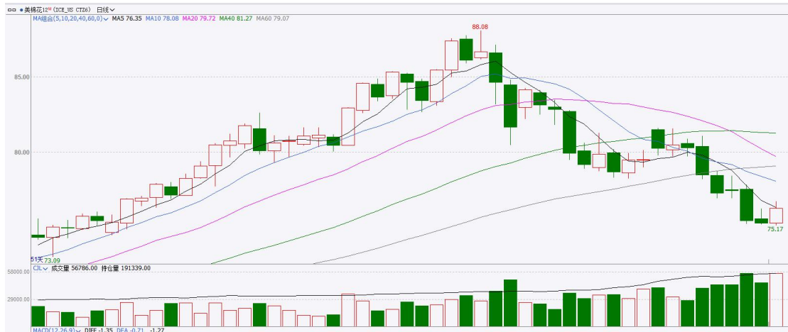
图表7：ICE美棉主力合约价格走势

国际方面，巴据美国农业部(USDA)报告显示，5月28日止当周，美国当前年度陆地棉出口销售净增18.52万包，较前周增加21%，较前四周均值增加62%。当周美国陆地棉出口装运量26.88万包，较前周减少15%，较前四周平均水平减少12%。当周美国棉花出口签约量增加、装船量环比下降。