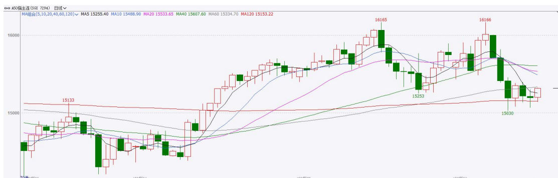
图表3：富时中国A50走势图

截至6月11日，富时中国A50指数下跌0.49%至15391.9；新交所富时A50期指主力合约下跌0.16%至15195。海外方面，美国总统特朗普表示，与伊朗“达成了极好的协议”，协议可能于本周末在欧洲签署。消息提升市场风险偏好，10年期、30年期美债收益率跌破4.5%及5%，欧美股市集体收涨，亚太股市今日亦集体高开。国内方面，经济基本面，贸易端，5月我国进出口延续高增长态势，出口边际增速高于进口，带动贸易顺差上行。同时，高新技术产品出口增速大幅领先整体水平。物价端，在PPI边际增速大于CPI，令两者正剪刀差进一步走阔。消息面，燧原科技与粤芯半导体申请IPO，而此前长鑫科技、宇树科技已相继过会，具有硬实力的科技企业陆续申请IPO，反映出当前市场对AI主题的热情依旧存在，但头部科技企业集中上市后也将对行业流动性产生稀释。整体来看，目前生产端价格上涨传导至消费端的过程较为缓慢，通胀对居民消费意愿的提振仍然有限。同时，市场对于AI行情的情绪已十分谨慎，不及预期的数据或消息均会加剧市场波动，加上美联储加息预期的升温带来的流动性趋紧预期，对海外人工智能浪潮有负面影响，最后海内外科技巨头相继递交IPO申请后带来的流动性稀释效果，使得相关板块承压，市场整体短期或步入震荡态势。