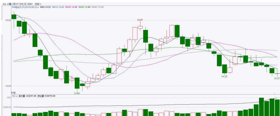
图表6: ICE原糖主力合约价格走势图

美糖主力价格关注上方压力15.0美分/磅, 下方支撑13.60美分/磅。建议7月 ICE 期糖短期观望。